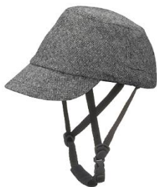
（株）日本パレード 商品名 ウォルナット 価格 7,000円台