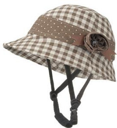
（株）日本パレード 商品名 カメリア 価格 8,000円台