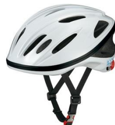
（株）オージーケーカプト 商品名 CS-1 価格 5,000円台