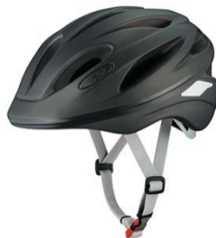
（株）オージーケーカプト 商品名 スクードL2 価格 5,000円台